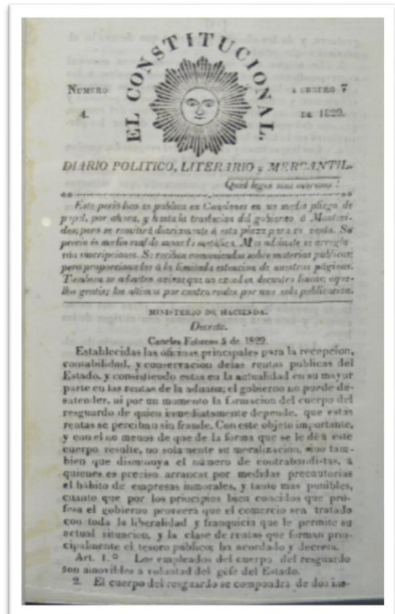
El Constitucional N°4 (7 de febrero de 1829)

El propósito principal del periódico consistía en “explicar [sic] y sostener la Constitución del Estado” (Zinny, 1883, p.36), lo cual seguramente fue la razón para publicar el proyecto de la Constitución, leyes y resoluciones emitidas por el gobierno, así como sesiones de la Asamblea General Constituyente y Legislativa. También se encontraron artículos editoriales sobre temas políticos y económicos, y cartas al editor. Asimismo, hay una sección de anuncios sobre entrada y salida de barcos, y de avisos comerciales dirigidos a la venta de esclavos, de productos, compra y venta de inmuebles, entre otros.