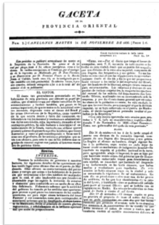
Gaceta de la Provincia Oriental N°1 (14 de nov. 1826)

Ni la «Estrella del Sur», ni la «Gaceta de Montevideo», ni el «Sol de las Provincias Unidas» — y no mencionamos al «Periódico Oriental», que se perdió como una bella ilusión en las páginas del Prospecto — fueron periódicos nuestros, no obstante la colaboración de alguna pluma criolla que pasó sin dejar ni huella duradera, ni siquiera pasajera influencia.” (p.20)