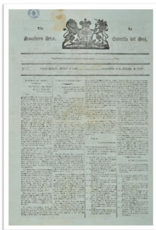
La Estrella del Sur/The Southern Star. Nº 7 (4 de julio de 1807).

La Estrella del Sur/The Southern Star fue publicado entre mayo y julio de 1807. Se imprimió semanalmente en la Real Imprenta de la Estrella del Sur; “primera imprenta que hubo en la ciudad” traída por los propios ingleses, aunque de ella “pocas noticias se tienen” (Estrada, 1912, p. 6). Fue el primer periódico bilingüe del continente lo cual se ha convertido en su nota distintiva al ser una característica muy poco común, especialmente en el periodismo de la época (Fernández de Castro y Henestrosa, 1941; González, 1942). Asimismo, su diagramación fue diferente al tipo de presentación que era costumbre en las gacetas españolas. La división en cuatro columnas por plana, los títulos y subtítulos, y el formato de los anuncios fueron innovadores con respecto a publicaciones realizadas en otras partes de las colonias (González, 1942; Álvarez Ferretjans, 2008).